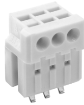
Darstellung vormontiert Designation pre-assembled